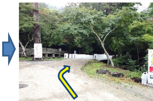
③ 【右折】橋を渡り境内に入る