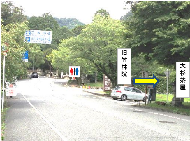
① 旧竹林院 と 大杉茶屋 の間の道を【北へ折れる】