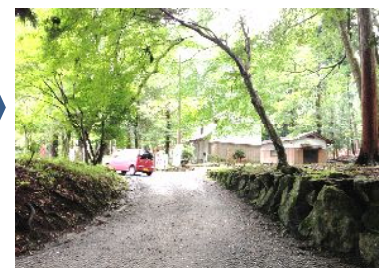
⑤ 登り切った左右の駐車場へ (50台)