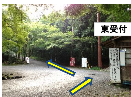
④ 受付にて入苑料を納め左側の坂を登る