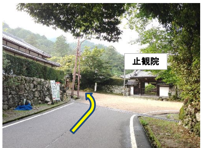
② 突き当り、止観院を【左折】 ※バスは右折して観光駐車場へ